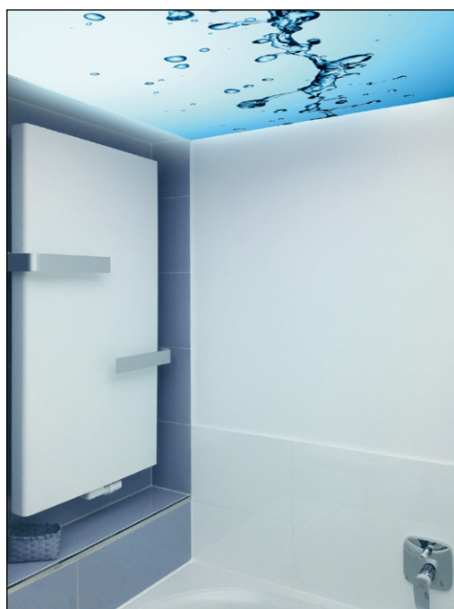
Auch an der Badezimmerdecke ist sie ein schönes Deko-Element und gleichzeitig Lichtquelle.

Die Lichtdecke besteht aus einem Aluminiumrahmen mit vorgespanntem und hinterleuchtetem Textil.