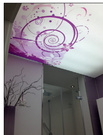
Die Lichtdecke leuchtet einen Raum gleichmäßig aus und zieht den Blick auf sich.

Das Rahmengerüst liefert Achte vorgefertigt; vor Ort wird es an die Decke geschraubt. Dann erst erfolgt das Anbringen des bedruckten und auf Maß gefertigten Stoffes mithilfe von angenähten Silikon- oder PVC-Kedern. Machbar sind durchaus mehrere Meter in der Breite und in der Länge. Wolfgang Dönges aus dem Vertrieb von Achte beschreibt: „Ich selbst habe zu Hause eine Licht-